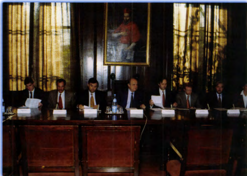
AZ OXFORDI KÖNYVKIÁLLÍTÁS SAJTÓTÁJÉKOZTATÓJA