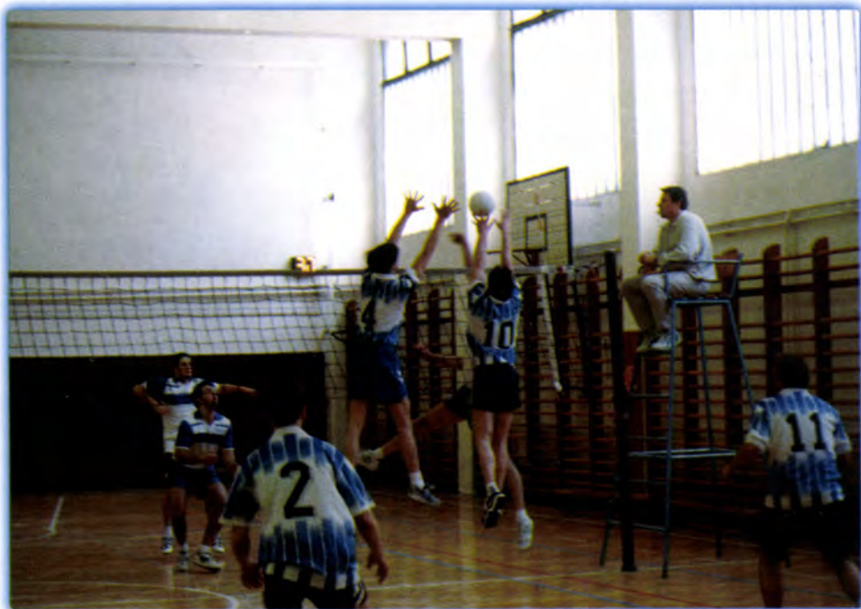
„ÉP TESTBEN – ÉP LÉLEK”