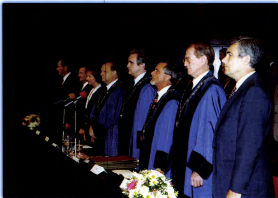
A DOKTORRÁ AVATÓ ÜNNEPSÉG ELNÖKSÉGE