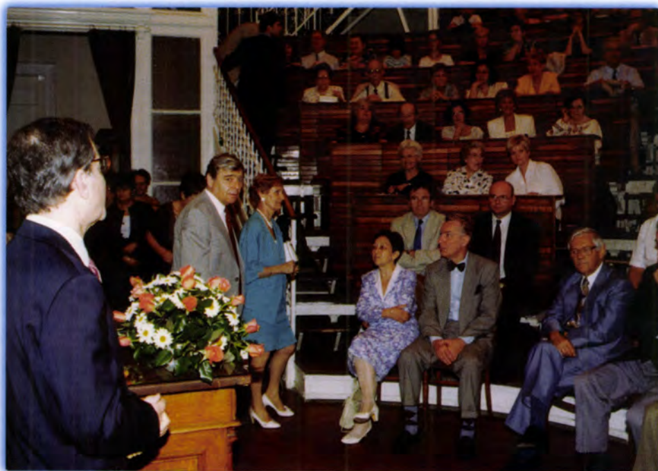
100. ÉVES AZ ANATÓMIAI INTÉZET