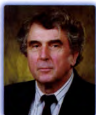
Dr. Réthelyi Miklós