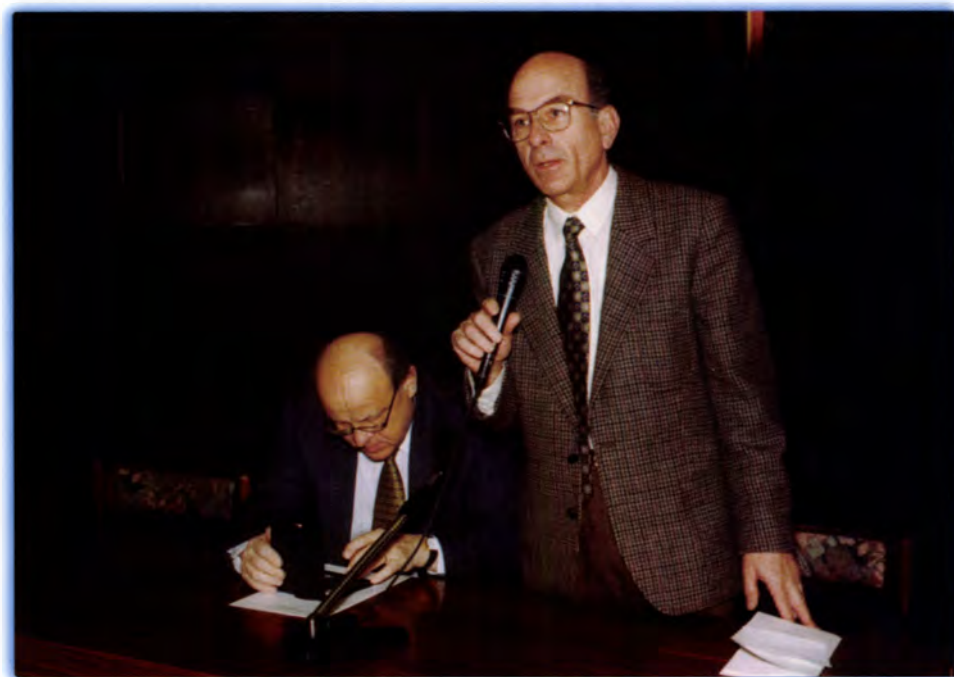
A TUDOMÁNYOS DIÁKKÖRI KONFERENCIA MEGNYITÓJA