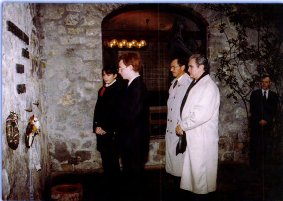
KOSZORÚZÁS SEMMELWEIS IGNÁC HAMVAINÁL