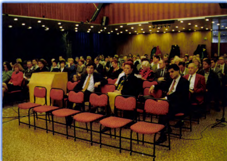
VITA A PÁRTOK EGÉSZSÉGÜGYI PROGRAMJÁRÓL