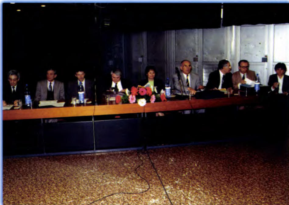
VITA A PÁRTOK EGÉSZSÉGÜGYI PROGRAMJÁRÓL