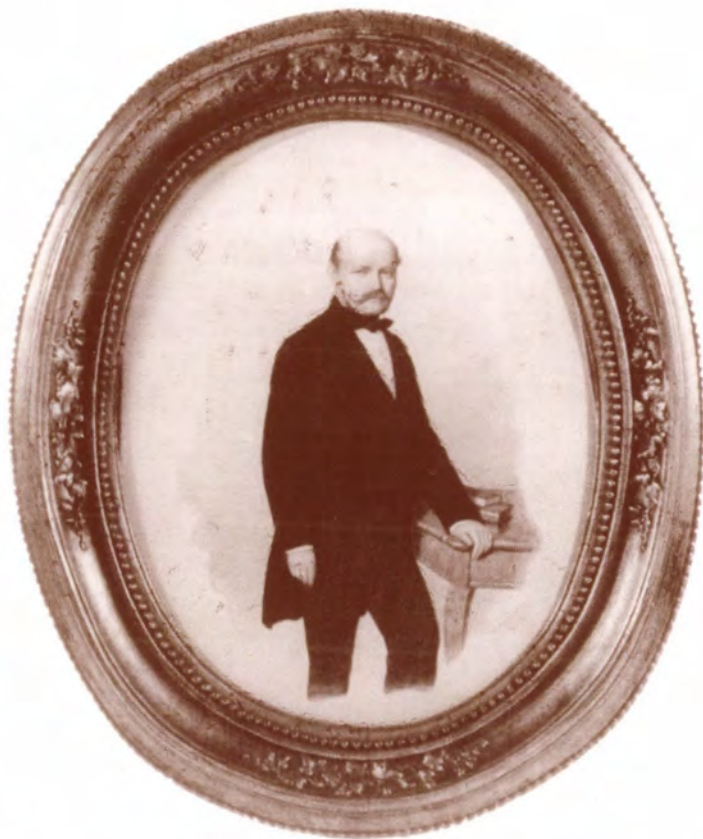
SEMMELWEIS IGNÁC FÜLÖP 1818 - 1865